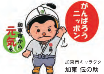
加東市キャラクター 加東 伝の助